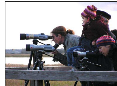
Beim herbstlichen Abendflug der Kraniche

Gemeinsame Beobachtung des Naturschauspiels an der Insel Kirr bei Zingst (bei gutem Wetter). In Kooperation mit dem Nationalparkamt. Treffpunkt: Aussichtsplattform am Zingster Bodendeich in Höhe der Tankstelle.