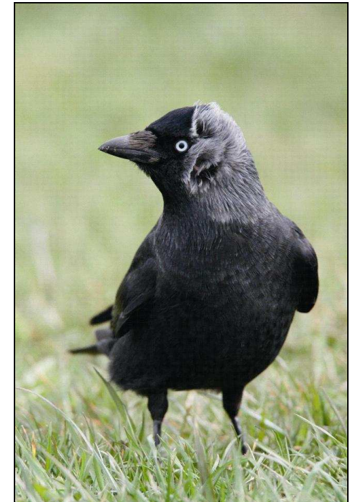
Der schlaue Vogel von Nebenan – die Dohle.